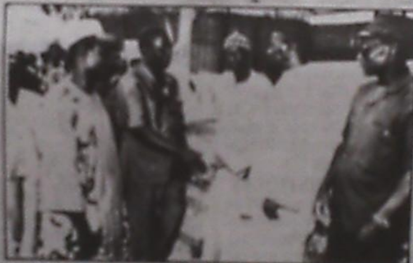
Le Haut Commissaire aux Iles de Loos

L'une des plus grandes réussites du gouvernement, ces quatre dernières années est la gestion exemplaire du Programme d'ajustement sectoriel de l'éducation (PASE). Cas d'école, il n'est pas superflu aujourd'hui, de revenir sur les acquis de ce Programme d'autant que l'idée d'un PASE II est en gestation.