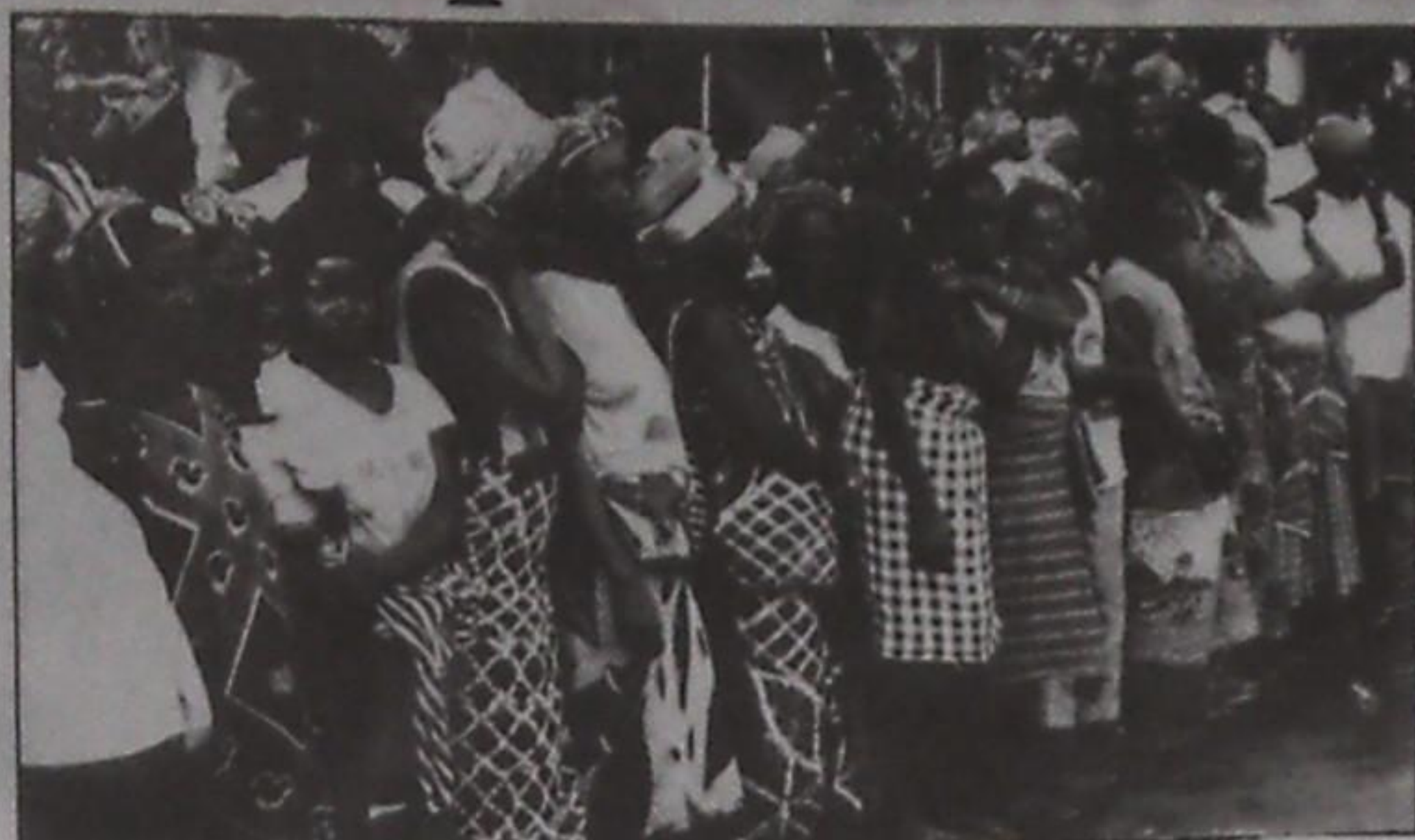
Angoisse et dénuement, c'est le lot des réfugiés que font les guerres fratricides

Globalement, les populations déplacées à l'intérieur de leur propre pays se chiffrent à 16 millions d'individus. Le Soudan vient en tête avec 4,5 millions suivi de l'Afrique du Sud 4,2 millions, du Mozambique de la Somalie et