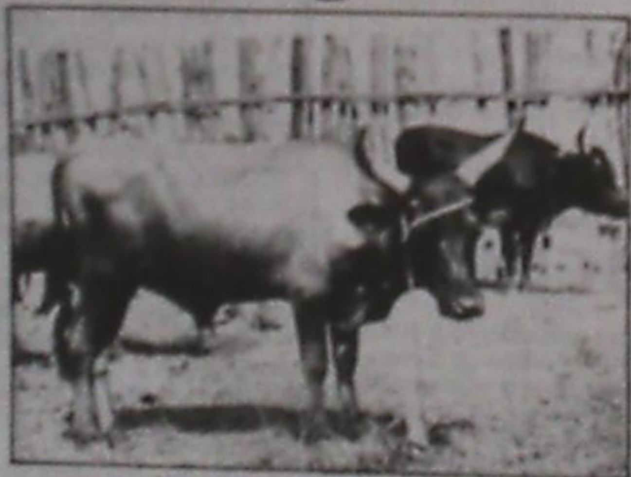
Un spécimen de la race N'Dama

En plus de sa fonction de recherche, le Centre de Famoïla aura pour vocation également l'embouche bovine par la production d'animaux de boucherie, la mise en place des cultures fourragères (maïs et autres espèces exotiques et locales), la formation des cadres et éleveurs et une contribution à la protection de l'environnement. Avec un effectif de 47 agents,