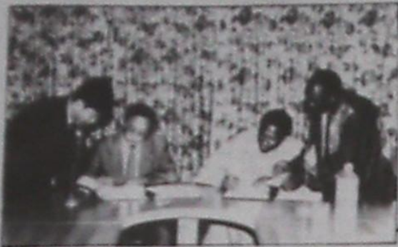
Une des nombreuses signatures d'accords de coopération.

Le Président Lansana Conté, au 30ème Sommet de l'OUA a insisté sur la nécessité de repenser et de renforcer la coopération africaine pour qu'elle aboutisse à la création de la Communauté Economique Africaine.