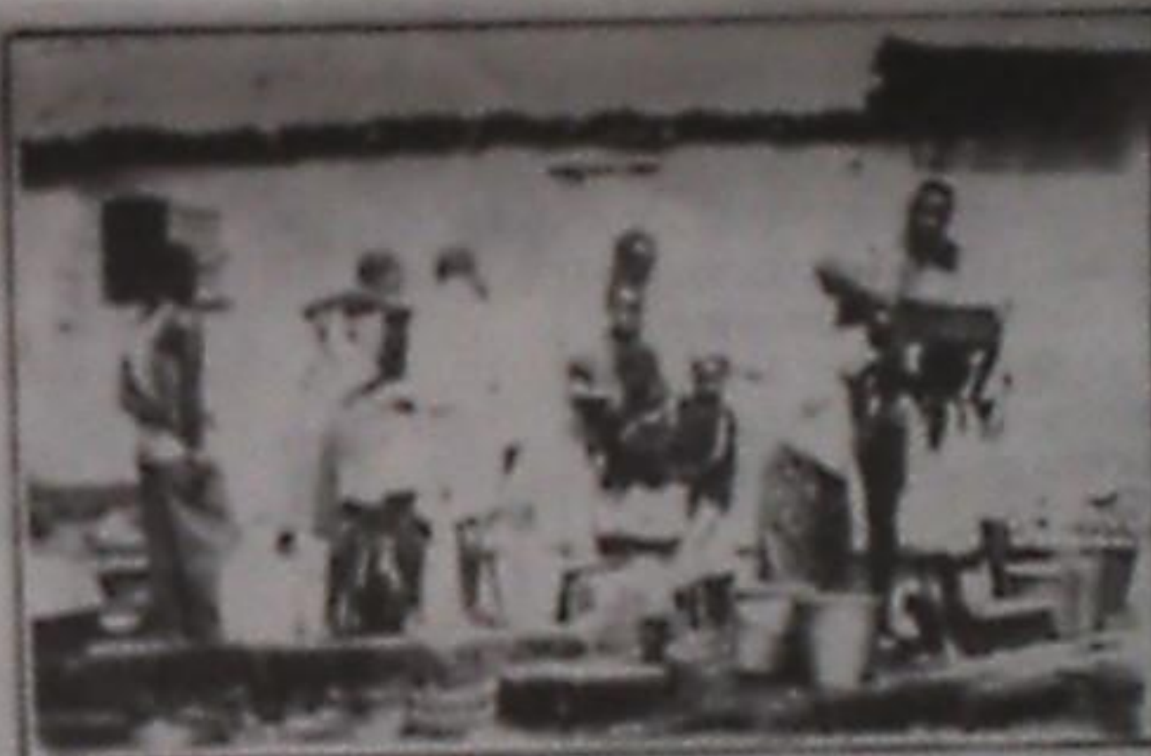
Les bornes fontaines toujours encombrées