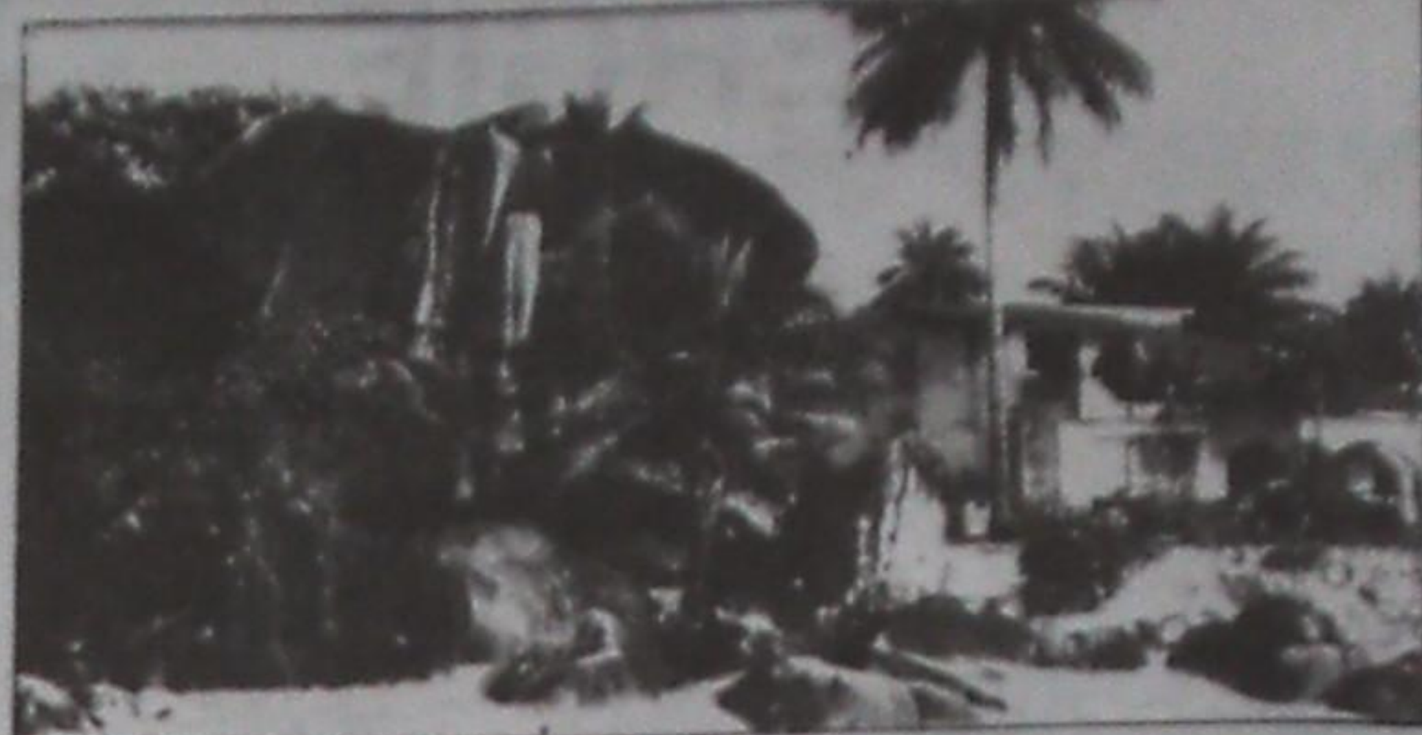
Un des splendides sites au large de Conakry

HOROYA : Peut-on présager du bilan que comptez-vous présenter à la fin de l'année 1995 ?