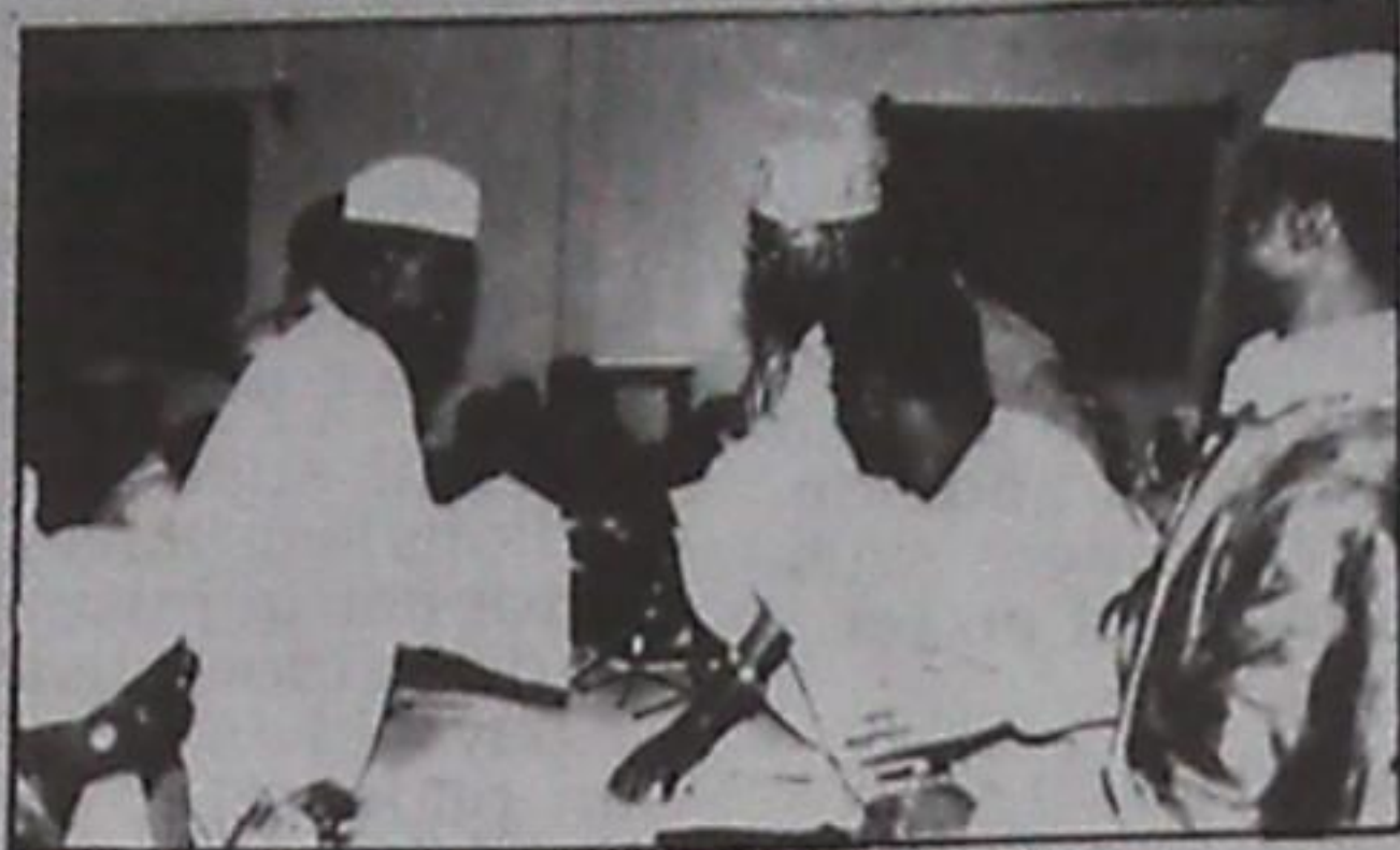
Les leaders de l'UNR et du PUP se félicitant de la signature de la Déclaration commune

Rétablir la sécurité des hommes et de leurs biens, et préparer les législatives dans le sens de l'engagement pris devant le peuple, demeurent l'enjeu prioritaire de ce début d'année et des mois à venir. Ce temps doit à tout prix être utilisé à bon escient pour contrer la montée de la criminalité, du grand et même du petit banditisme qui, lui aussi, tue des innocents depuis que les pick-pockets ont commencé à «opérer» par étranglement. Parce que si les temporisations et les hésitations persistent le cours des événements risque de ressembler à un marathon où d'autres questions, plus graves peut-être, viendront se greffer à l'essentiel qui exigera dès lors une révision des données.