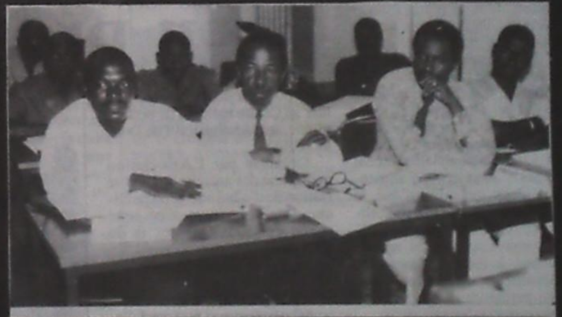
Des participants au cours de perfectionnement