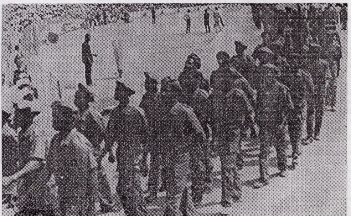
Le défilé de la milice populaire gardienne des acquis de la Révolution.