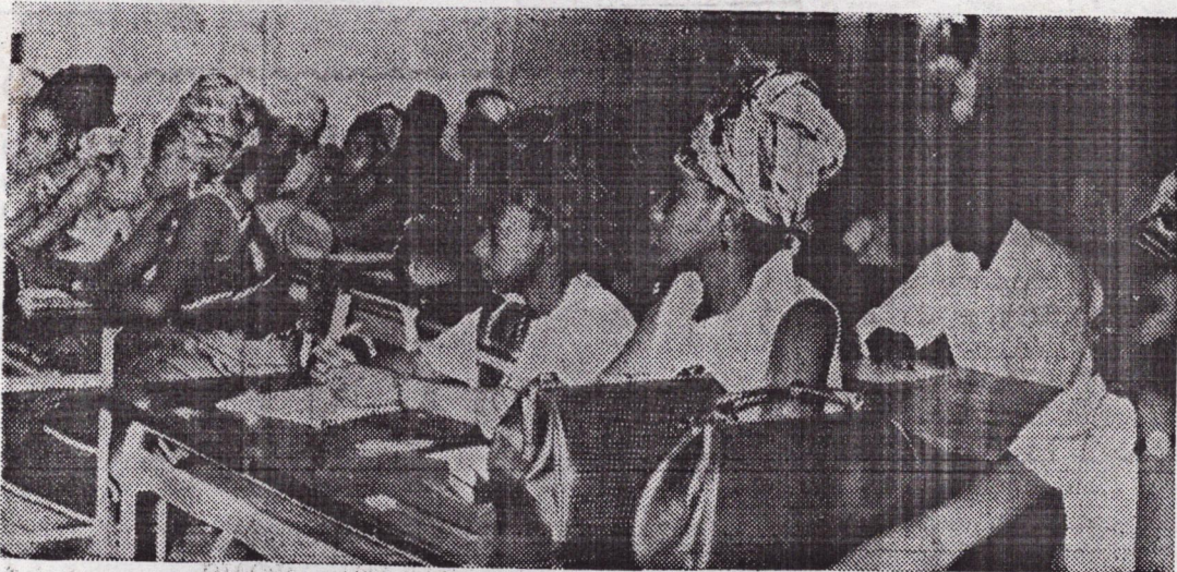
Une vue de la salle des séminaristes

En effet l'enfant d'aujourd'hui n'est-il pas le citoyen à part entière,