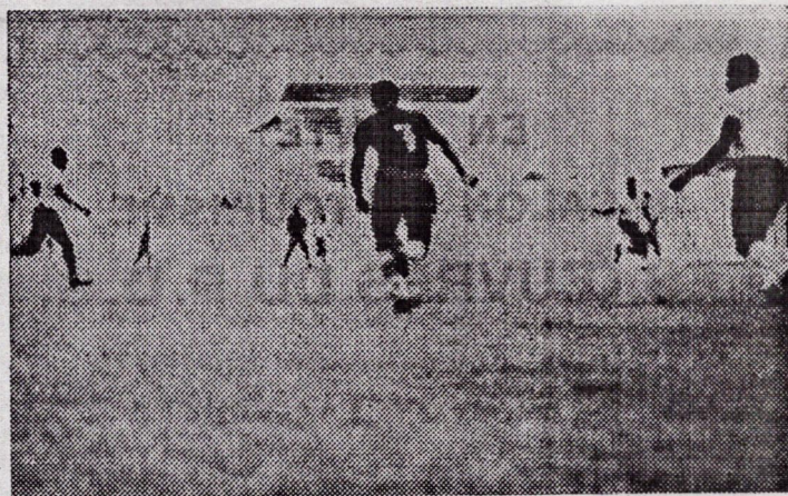
Ce joueur porteur du n° 7 est l'ailier droit de la Guinée Forestière.