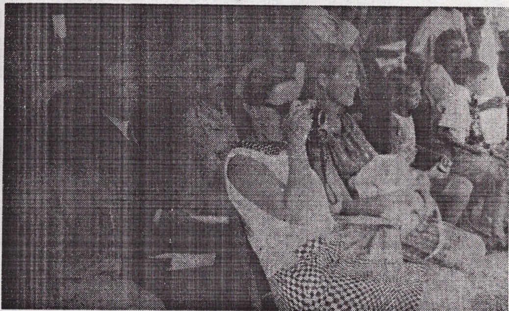
Du balcon de l'Hôtel de la «Forêt sacrée» les touristes contemplent les artistes exécutant des danses folkloriques.

A Lola, comme à la station du Mt Nimba, l'accueil a été marqué par d'importantes manifestations et de danses folkloriques. Après avoir pris leur